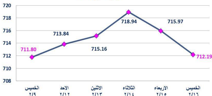
مؤشر السوق ISX60